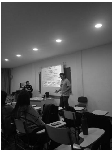
URV Educació Social.

Per tal de promoure la creació de grups d'iguals per la prevenció i la reducció de riscos en el territori s'ha realitzat una sessió informativa sobre les nostres accions a alumnes de 1er i 2on del Grau Superior de Formació Professional en Integració Social (INS BAIX CAMP) durant el mes de març de 2022. També s'ha realitzat un taller informatiu a alumnes del Grau d'Educació Social (URV) i del Grau de Treball Social (URV) durant el mes de novembre de 2022.